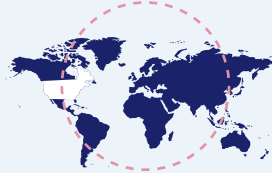
ทั่วโลก ยกเว้นสหรัฐอเมริกา Worldwide excluding USA